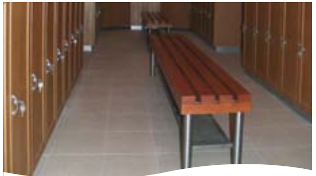
BANCO DE ACERO INOXIDABLE Y MADERA