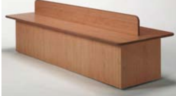
BANCO DOBLE CENTRAL