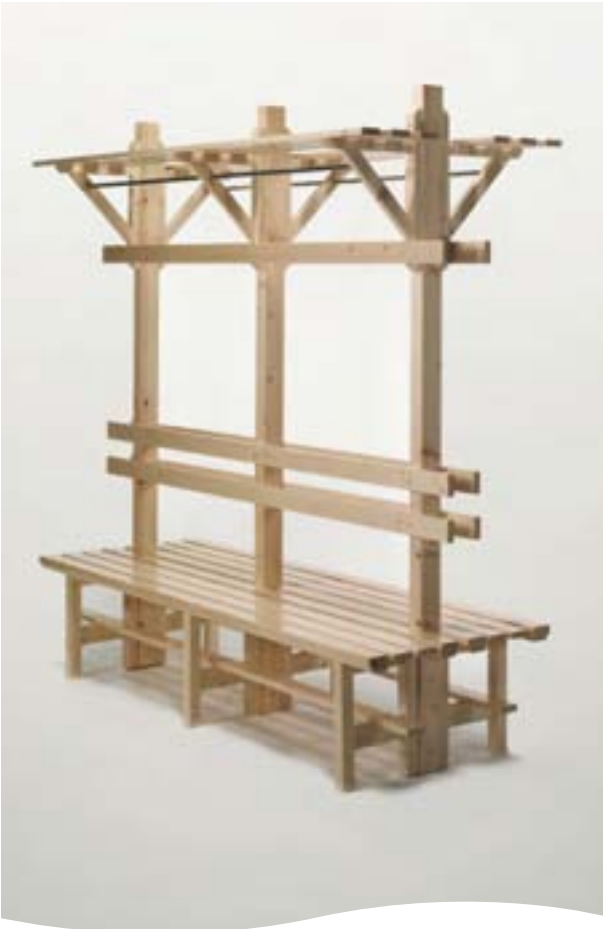
MÓDULO CENTRAL ALTO