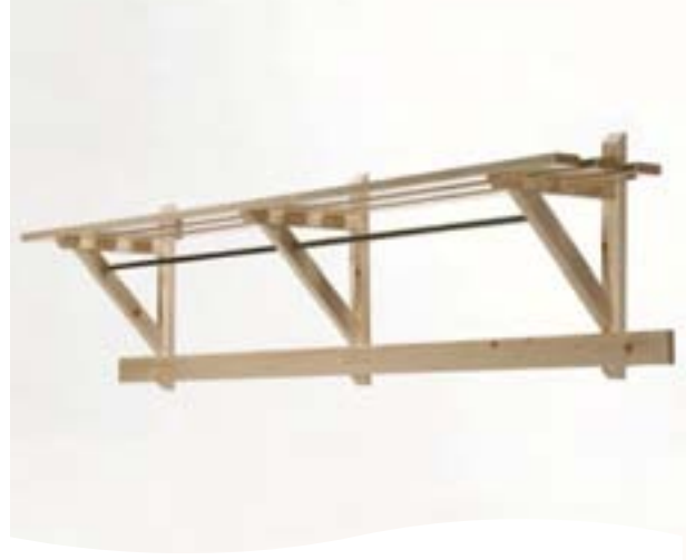
PERCHERO CON SOPORTE