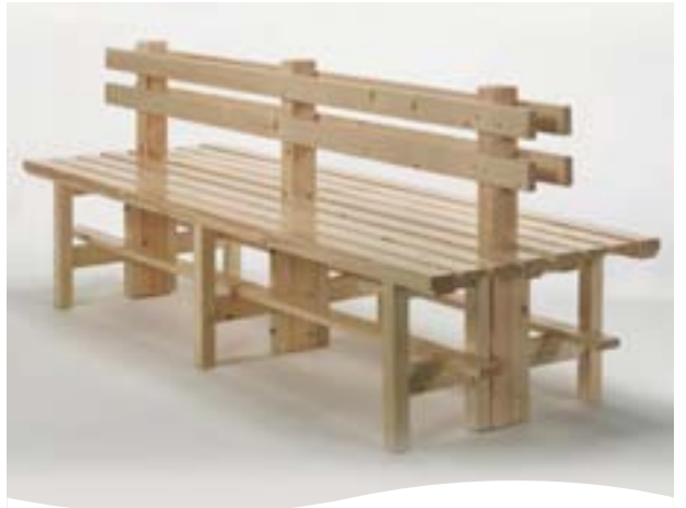
MÓDULO CENTRAL BAJO