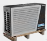
Entrega en palé de madera