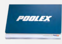
Caja de mantenimiento incluido el manual de uso en varios idiomas