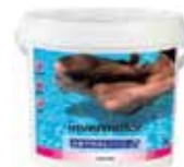
LIMPIEZA, FLOCULANTES Y ACCESORIOS