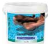
ALGICIDAS E INVERNADORES