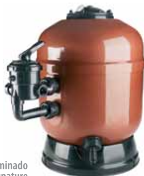
Filtro laminado AstralPool Signature