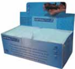
Cartucho de floculante (envuelto en film plástico macroperforado)