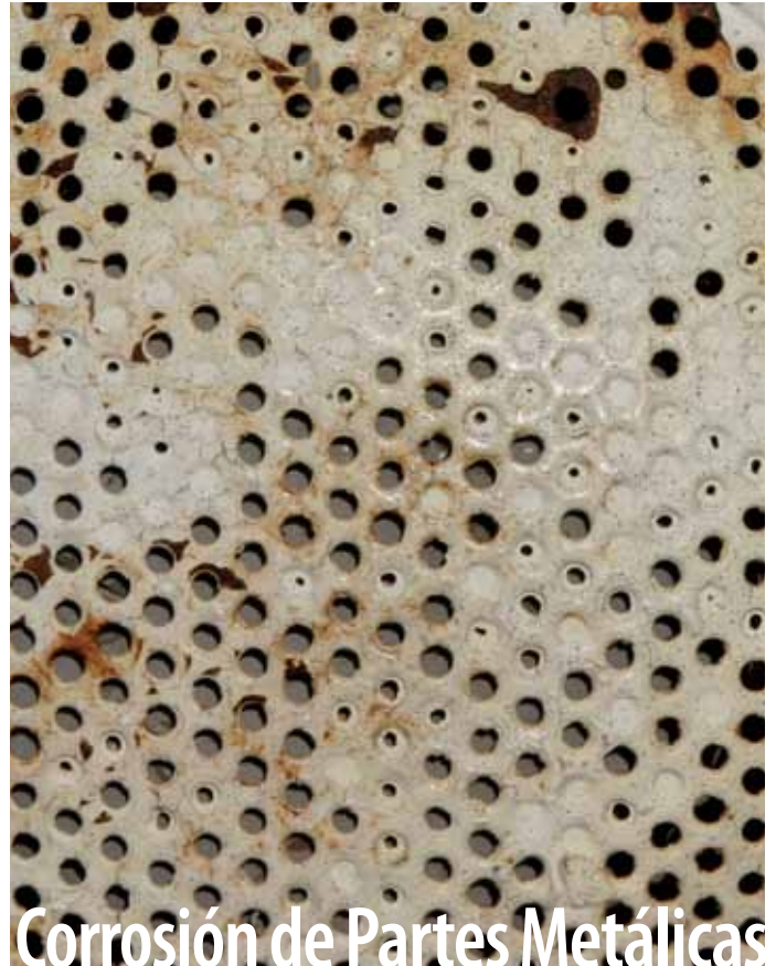
Corrosión de Partes Metálicas